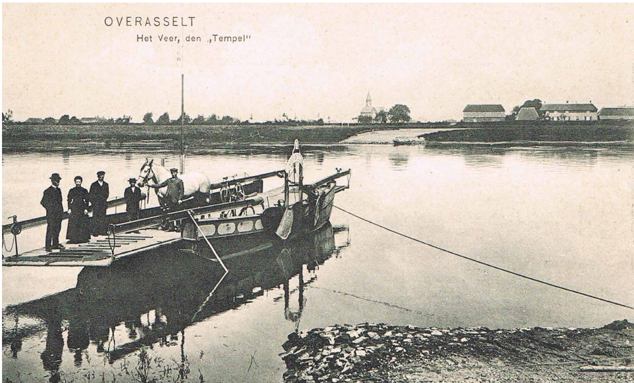
OVERASSELT Het Veer, den „Tempel“