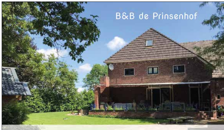
B&B de Prinsenhof

Verhuur Kantoor- en Bedrijfsruimte De Nieuwe Erven 10-12 • 5431 NT Cuijk tel: 06 55 39 69 84 • b.g.g. 06 21 52 52 17